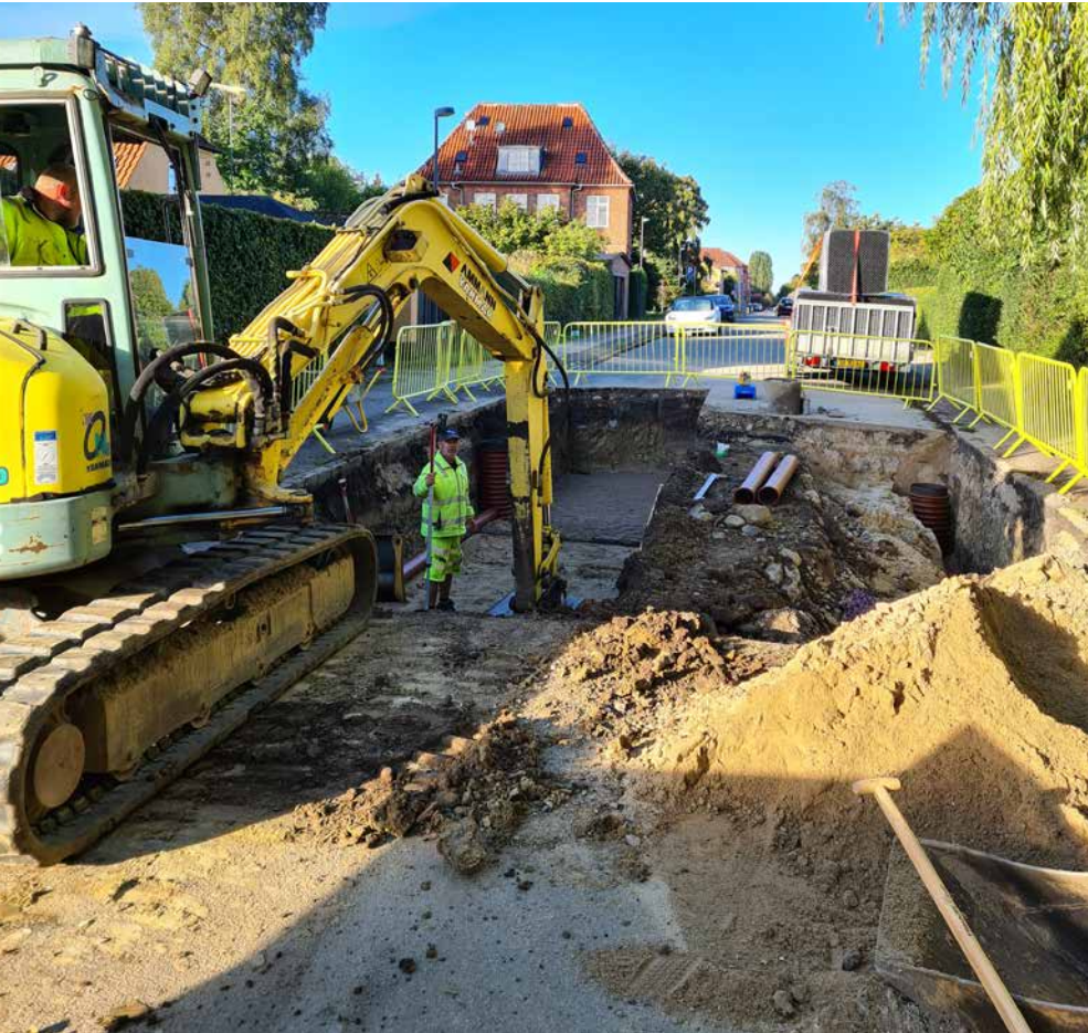
Udgravning til regnbed

operation at etablere vejbede på en lille villavej. Både i form af opgravninger, afspærringer og kørsel med store maskiner. Men det er gået over al forventning. Beboerne har været super imødekommende og fleksible. Vi har selvfølgelig gjort alt for at informere og holde byggeprocessen kortest mulig på de enkelte vejstrækninger, men havde alligevel frygtet, at generne havde givet utilfredshed. Det er ikke sket.