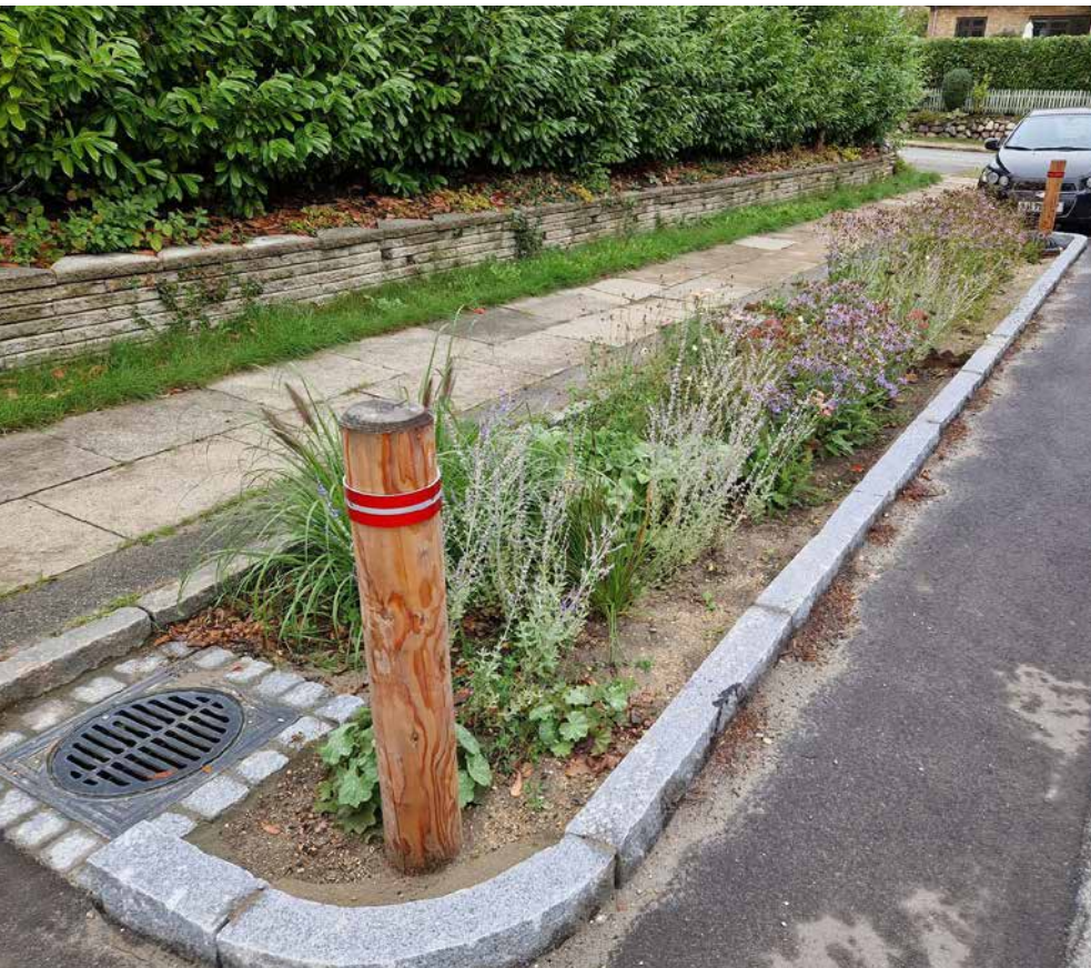
Sådan kan et færdigt regnbæd se ud