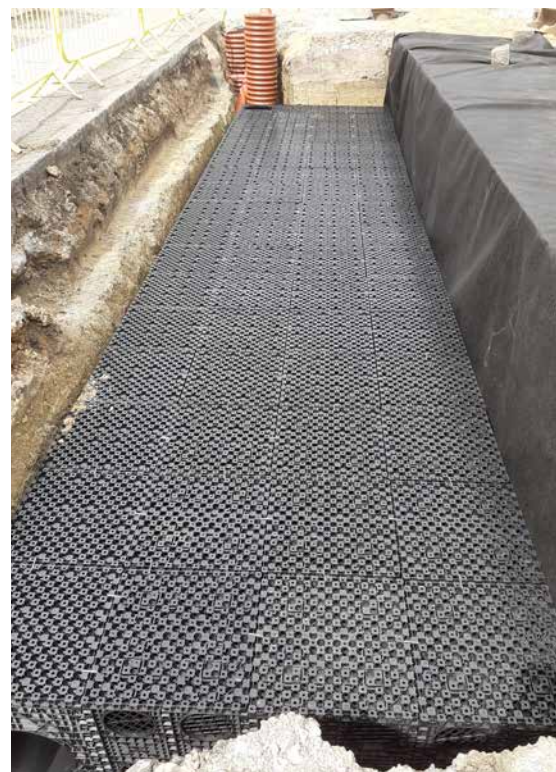
Faskiner under regnbæd

Men vigtigst af alt. Både bestyrelse og beboerne er rigtig glade i de foreninger, hvor vi har etableret bede. Ikke kun for det færdige resultat, men også for processen. For det skal ikke være nogen hemmelighed, at det er en voldsom ►