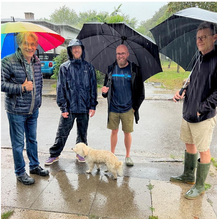
Sommerfestudvalget på Langvaddam den 27/8 kl. 10.15

Festudvalget havde udarbejdet et fint program og Eigils søn havde designet et fint opslag – men på dagen måtte vi aflyse på grund af skybrud hele morgenen og formiddagen.